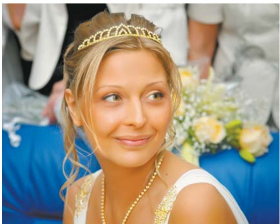
Пользователь CPMS: Krasava