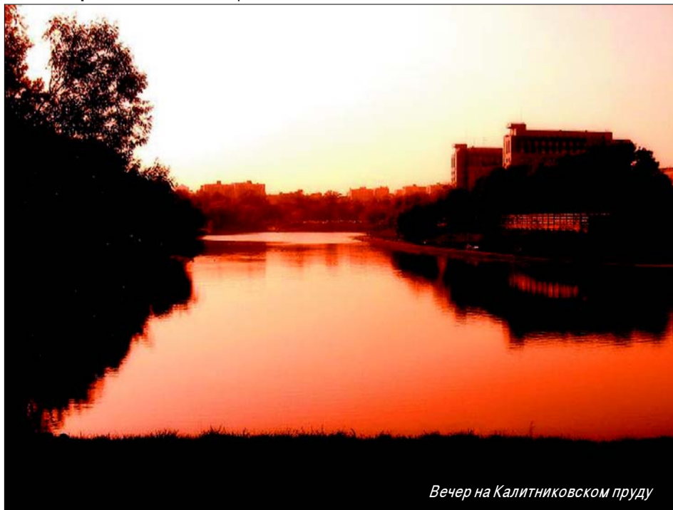
Вечер на Калитниковском пруду