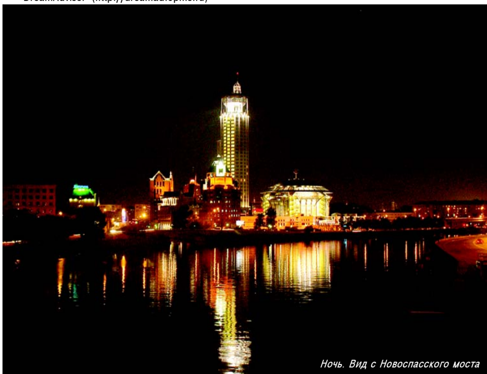
Ночь. Вид с Новоспасского моста