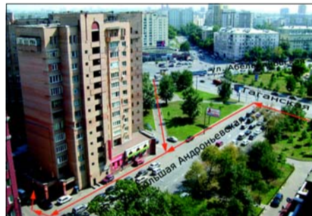
Терминал на Большой Андроньевской улице Терминал установлен в студии красоты «Александрия» по адресу: ул. Большая Андроньевская, 25/33, вход рядом с подъездом 6.