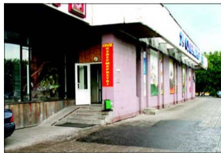
Терминал на Марксистской улице Терминал установлен в продуктивном супермаркете по адресу ул. Марксистская, 9. (Работает круглосуточно.)

С 1 января 2008 года закрывается офис приема платежей на Таганской улице, 36. Вместо него можно пользоваться несколькими круглосуточными терминалами приема платежей, которые работают без процентов и комиссий.