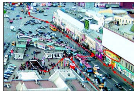
Терминал на Таганской площади Терминал установлен в студии загара по адресу: ул. Таганская, 1 корп. 2, 2-й эт. (Работает круглосуточно.)