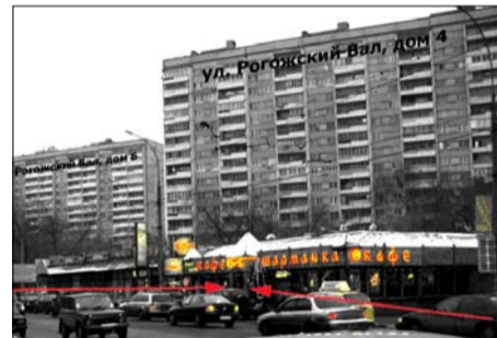
Терминал на улице Рогожский Вал Терминал установлен в холле кафе «Шарманка», напротив Рогожского рынка, по адресу: ул. Рогожский Вал, 4.

Мы продолжаем работать над установкой новых терминалов на территории Таганского района. В новом году их станет больше!